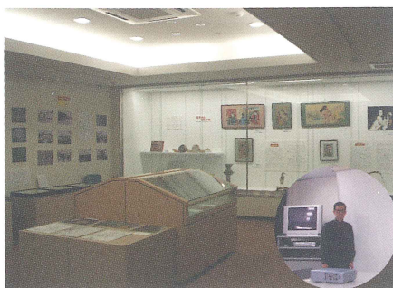
信太山ふるさと館にプロジェクター寄贈

今後も地域に密着したアクティビティをみなさんとともに学び、ともに考え、ともに協力し、和気あいあいと楽しく進めていきたいとこの様に念じております。