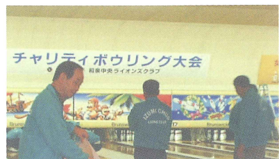
チャリティーボウリング